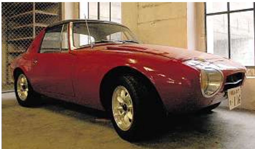
Einer von wenigen: Der Toyota Sports 800 aus dem Jahr 1968 hat in der Schweiz Seltenheitswert.