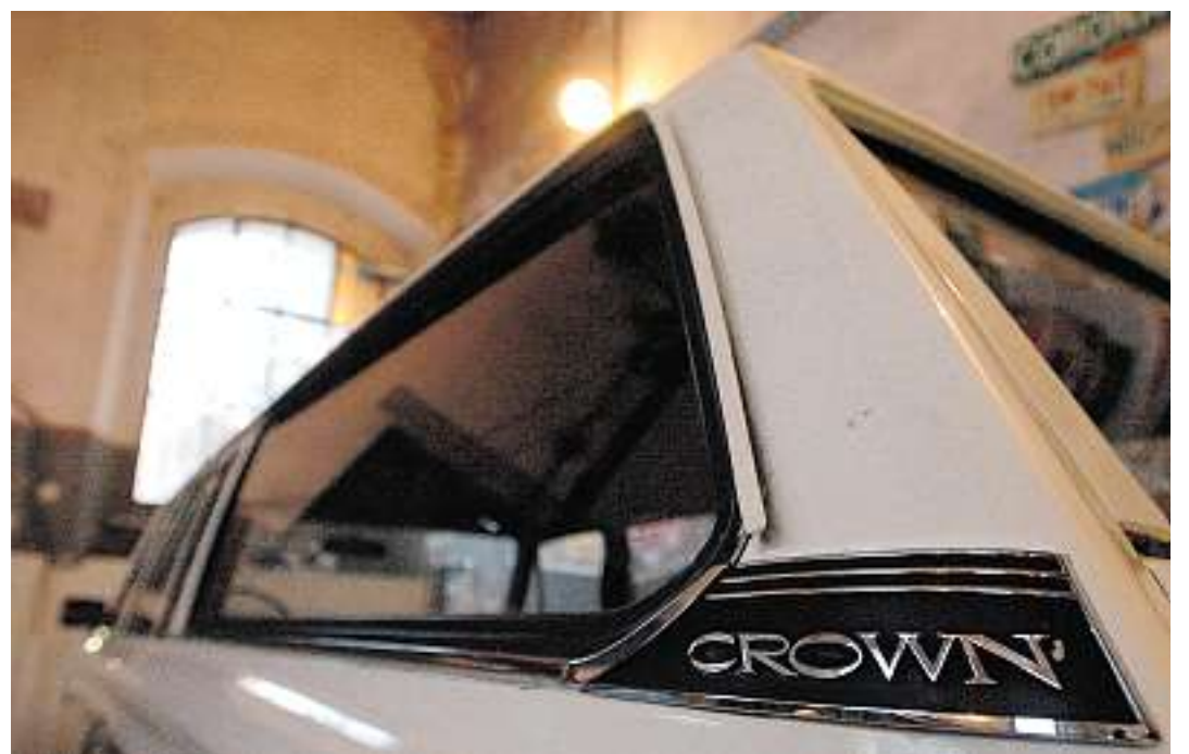
Nostalgie pur: Auch Crown-Modelle aus den Sechzigerjahren gibt es zu entdecken.